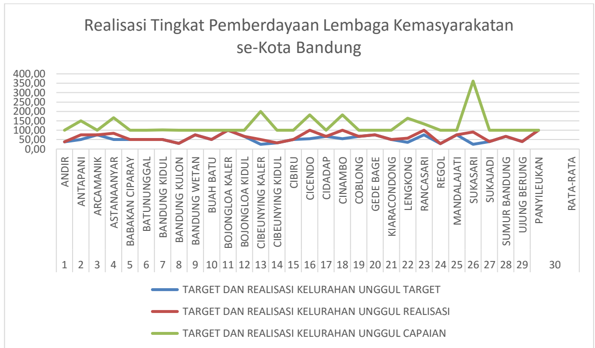
Grafik 3.3.1 Perbandingan Tingkat Pemberdayaan Lembaga Kemasyarakatan Tahun 2020

Bila melihat tabel dan grafik untuk capaian tingkat pemberdayaan lembaga kemasyarakatan dibandingkan dengan kecamatan lain bervariasi sehingga dari tabel dapat dilihat menduduki ranking 1 sampai dengan ranking 30. Hal ini disebabkan beberapa faktor diantaranya :