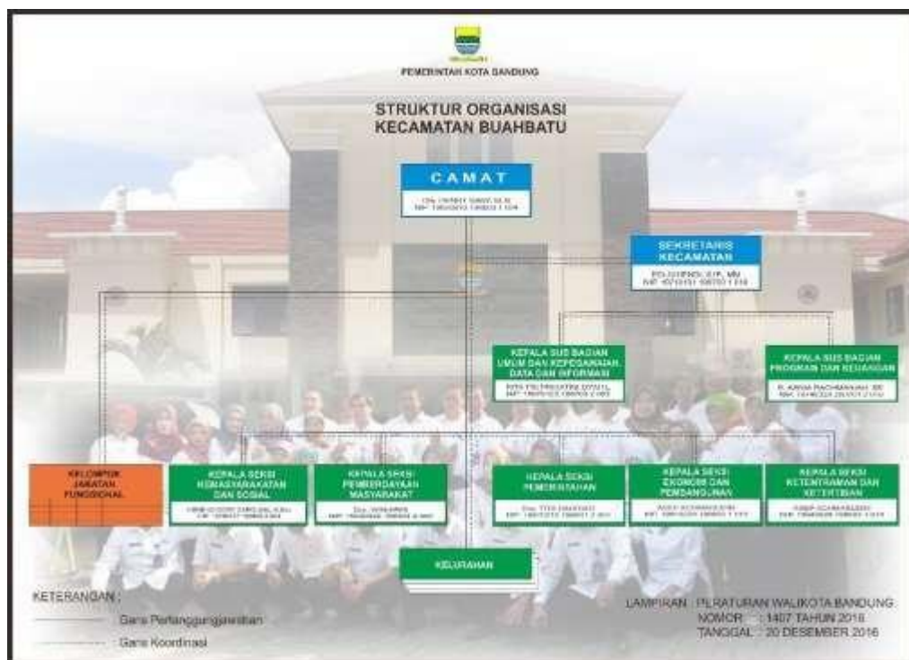
Gambar 1.2 BAGAN STRUKTUR ORGANISASI KECAMATAN BUAHBATU