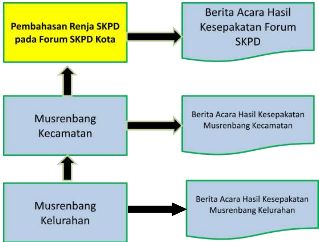
Gambar Alur Proses Musrenbang Kecamatan