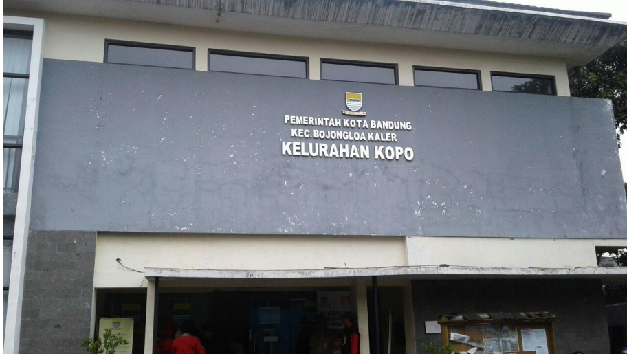
FOTO Kantor Kelurahan Kopo