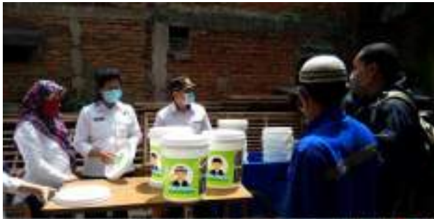
Kegiatan Zerro Waste (kangpisman), @RW. 08 Kel. Cibuntu