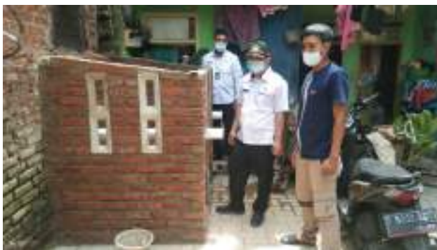
Pengolahan Sampah Komposter @RW. 08 Kel. Cibuntu