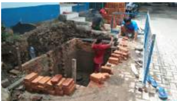
Pembuatan Septictank Komunal @RW. 10 Kel. Cibuntu