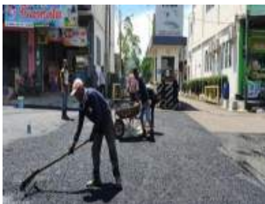
Pemeliharaan Jalan Hot Mix Terhampar @RW 03 Kel. Cijerah