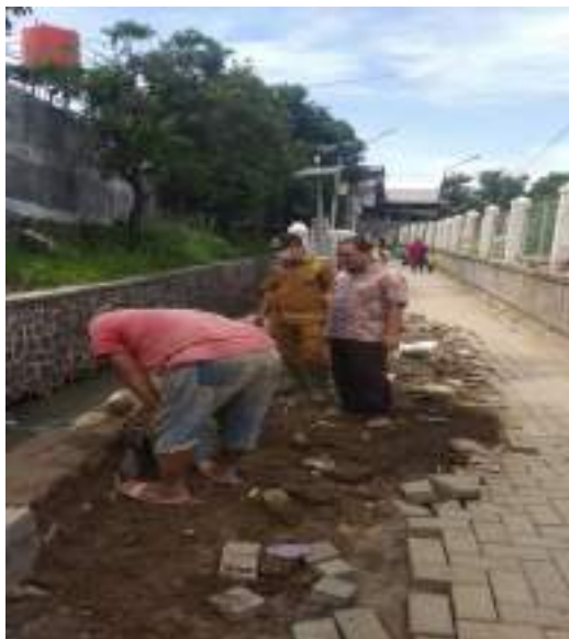
Perbaikan Kirmir RW.10 Kel. Cibuntu