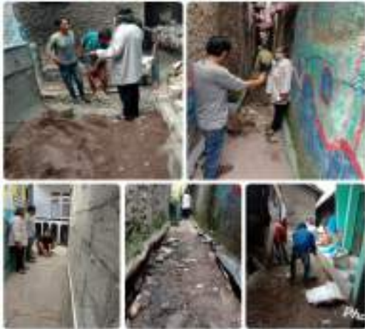
Pemasangan Paving Blok Dari Dana PIPPK Tahun Anggaran 2020 @RW. 01 Kel. Caringin