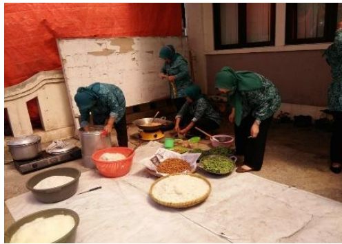
Gambar 3.3. Sangu Bancakan Urang Bandung