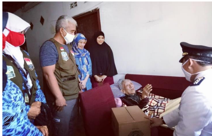
Gambar 3.6. Pemberian Bantuan Kepada Lansia