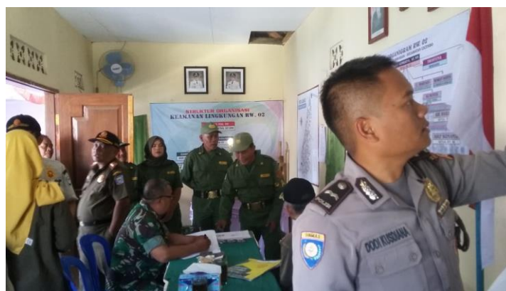
Gambar 3.7. Penilaian Siskamling