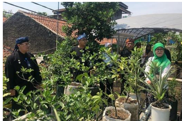
Gambar 3.9. Urban Farming