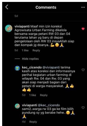
Gambar 3.10. Penilaian Publik dari Media elektronik