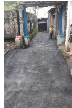
Gambar 3.2. Perbaikan Jalan