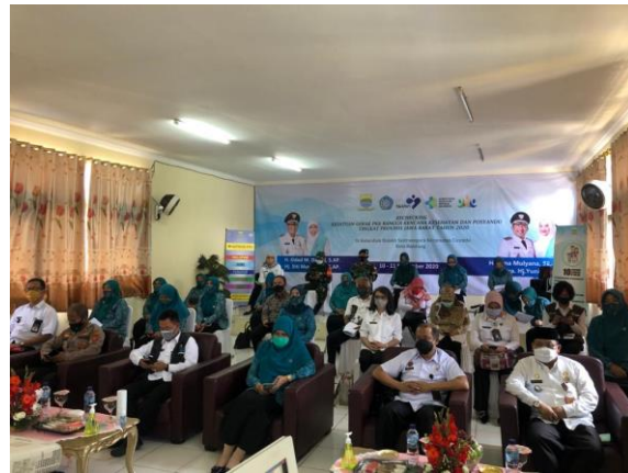
Gambar 3.8. Rechecking Kesrak PKK bangga kencana kesehatan dan Posyandu tingkat provinsi jawa barat