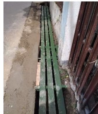
Gambar 3.4. Pemeliharaan Saluran Air