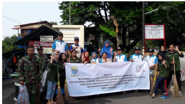
Gambar 3.5. Pelaksanaan Kegiatan BBGRM