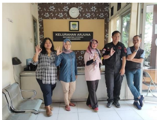
Gambar 3. 1. Pelayanan pada Masyarakat di Kecamatan dan Kelurahan