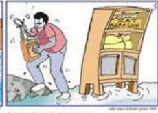
Amanatkan alat yang akan terendam air Amanatkan alat yang akan terendam air Secure the personal material which may submerge in water