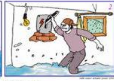
Maukan air tidak ? Perhatikan air dan lokasi pengungsian Check off your house of safety ?