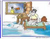
Dengarkan radio dan pengumuman banjir di lingkungan anda Dengarkan radio untuk memantau informasi ancaman banjir Listen to the radio or other information on flood in your area