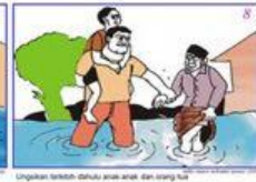
Lakukan tindakan darurat untuk anak-anak dan orang tua Lakukan tindakan darurat untuk anak-anak dan orang tua Evacuate children and old people