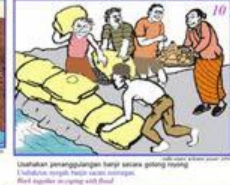
Uraikan penanggulangan banjir secara gotong royong Uraikan penanggulangan banjir secara gotong royong Flood relief involving with flood