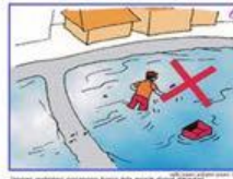
Jangan melintasi genangan banjir bila masih dapat dilewati Jangan melintasi genangan banjir bila masih dapat dilewati Do not cross the floodwater when it can be avoided