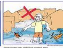
Jangan berjalan-jalan sendirian di genangan banjir Jangan berjalan-jalan sendirian di genangan banjir Do not walk without company in the floodwater