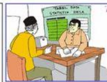
Laporkan kejadian banjir ke petugas setempat Laporkan kejadian banjir ke petugas setempat Report flood condition to local official