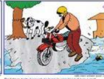
Pindahkan harta bergerak ke tempat yang tinggi di luar rumah Pindahkan harta bergerak ke tempat yang tinggi di luar rumah Move your movable goods to higher places away from the floodwater