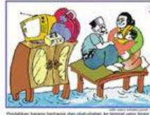
Pindahkan barang berharga dan dibersihkan ke tempat yang lebih tinggi Pindahkan barang berharga dan dibersihkan ke tempat yang lebih tinggi Move your valuable belongings and washable supplies to a higher place