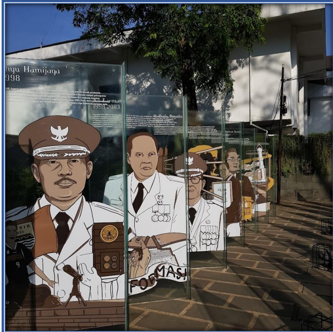
Taman Pet Park